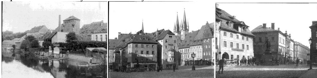
Ukázky digitalizovaných fotografií

Vzájemné soužití Čechů a Němců bylo a je dosud poznamenáno událostmi, které dodnes přinášejí mnohé nejasnosti a nedorozumění. Jednou z překážek většího porozumění je skutečnost, že v minulosti došlo k násilnému roztržení celé řady cenných archivních souborů, které se v současné době nacházejí na obou stranách hranice, převážně v českých a bavorských státních archivech.