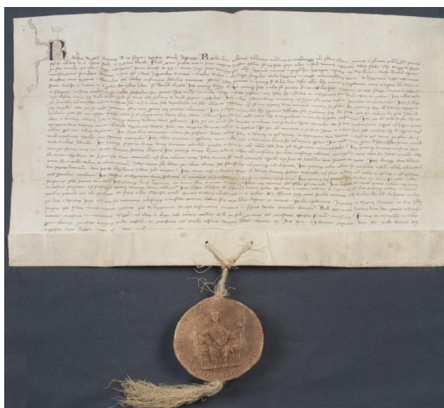
Ukázka digitalizované listiny (Rudolf I. Habsburgský 1279, SOkA Cheb, listina č. 2)

Zatímco v českých archivech je uloženo mnoho archivních fondů, jež se vztahují k dějinám Němců v Čechách, má mnoho co nabídnout i německá strana: Bavorský hlavní státní archiv v Mnichově spravuje fondy Sudetoněmeckého archivu, které obsahují celou řadu dokumentů pocházejících z dnešního území České republiky a jež se s odsunem německého obyvatelstva po 2. světové válce dostaly za hranice, především do Spolkové republiky Německo. Jde o archiválie měst a obcí, o fotografie, šlechtické a církevní archivy, o obecní, školní a farní kroniky a jiné dokumenty místního a regionálního významu. Státní archiv v Amberku navíc provede digitalizaci velmi významného a cenného fondu listin cisterciáckého kláštera ve Waldsassenu, který čítá 1900 kusů listin z let 1132–1797.